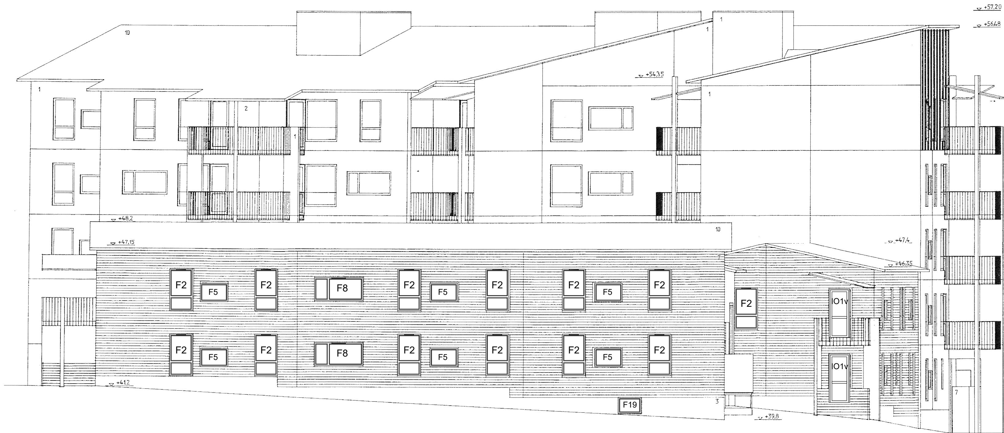
julkisivu etelään 1:100